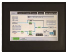
提供触摸屏大屏方案机型